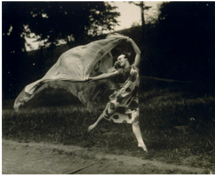
Loie Fuller, amerika. Ausdruckstänzerin *22.1.1862, Illinois - 2.1.1928, Paris